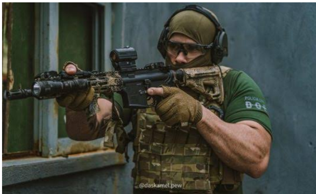
Operador do CORE de SC

Princípios esses herdados de equipes táticas, que tem diversos apetrechos "Táticos Operacionais" que auxiliam sua eficiência para tais tarefas como granadas de luz, de som, explosivos... etc que podem ser usadas para alcançar a surpresa. Sozinho você usará outros mecanismo para alcançar a surpresa, como, por exemplo, não ser visto, manter o silêncio e aparecer em lugares inesperados. A surpresa aqui, é quando sua entrada não é comprometida.